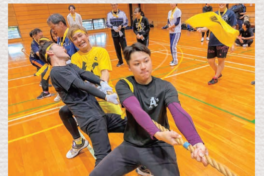
毎年恒例の社内運動会。ボーリング大会やバーベキューなど、自由参加の楽しい行事が毎月あります。