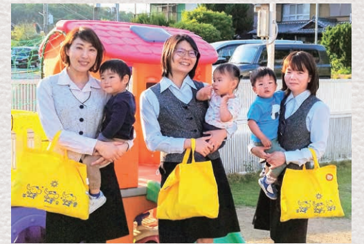
企業内保育所は2013年にオープン。地域住民も利用できます。

21年に姫路工場を増築した際には、社員が休憩や食事に向かうオープンテラスをくつろげるカフェ風に改装しました。「社員が生き生きと働くための投資は惜しみません。会社が成長を続けるためにも、継続していくことが大事」と梅田社長。活気あふれる職場づくりはこれからも続きます。