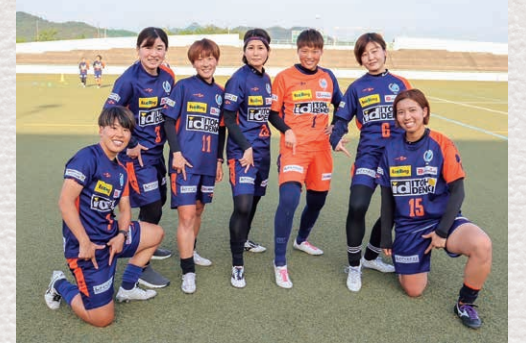
サッカー女子「ASハリマアルビオン」の選手が7人在籍。業務をこなしながら活躍しています。