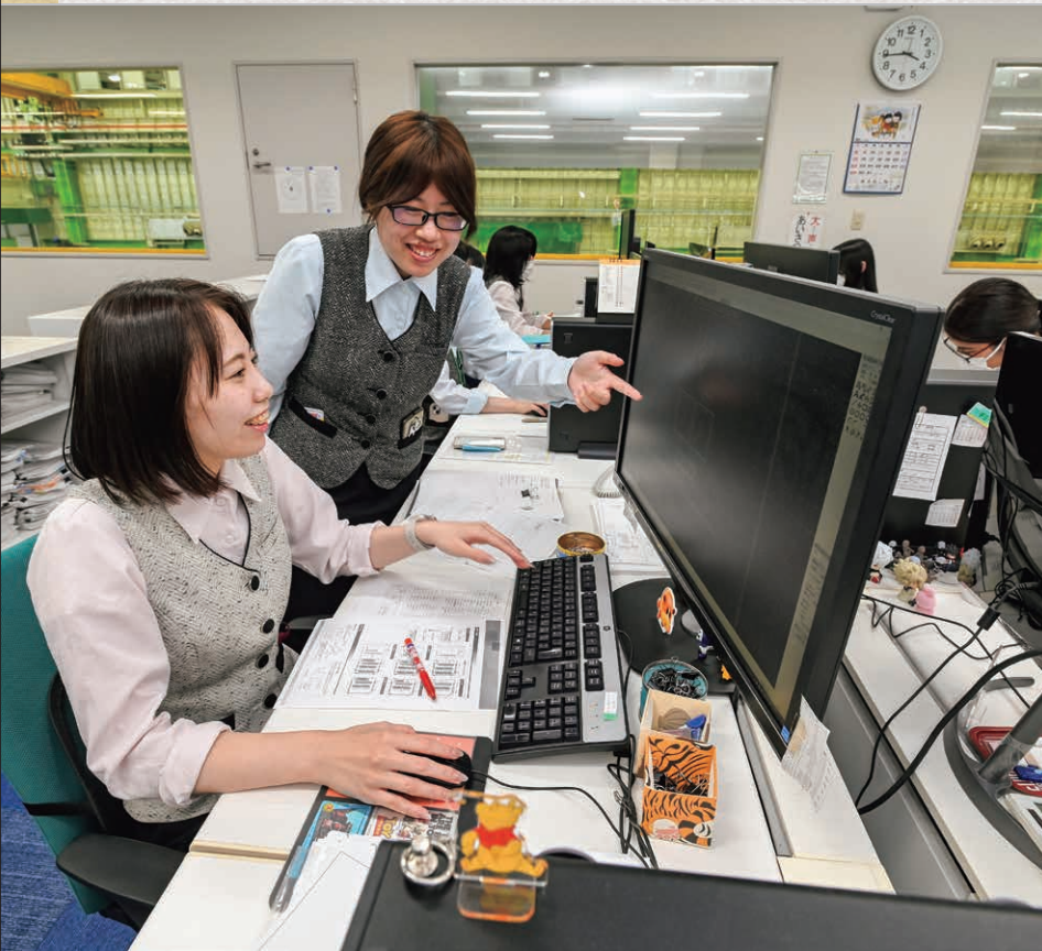
CADオペレーターは全員女性。先輩社員がマンツーマンで丁寧に指導するので、文系出身者でも安心です。

従業員の8割を男性が占める配電・制御盤の設計製造業界において、同社は女性の能力を高く評価。20年以上前から女性社員を積極的に採用してきました。女性が働きやすい職場づくりを推進し、順調に業績を拡大。女子サッカー選手の雇用など、地域貢献でも注目されています。